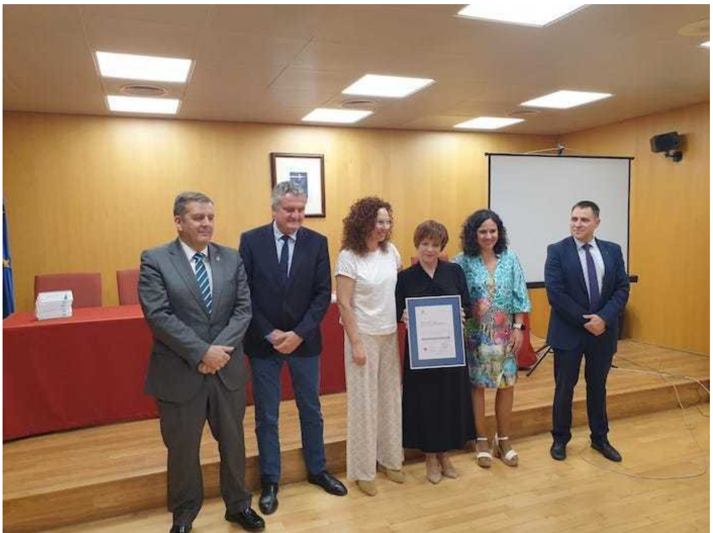
i Nuevo certificado de calidad en el Hospital de Poniente

El servicio recibe el distintivo de Nivel Avanzado de la ACSA, que señala entre sus fortalezas ámbitos como la investigación, la formación, el uso de nuevas tecnologías o la seguridad del paciente