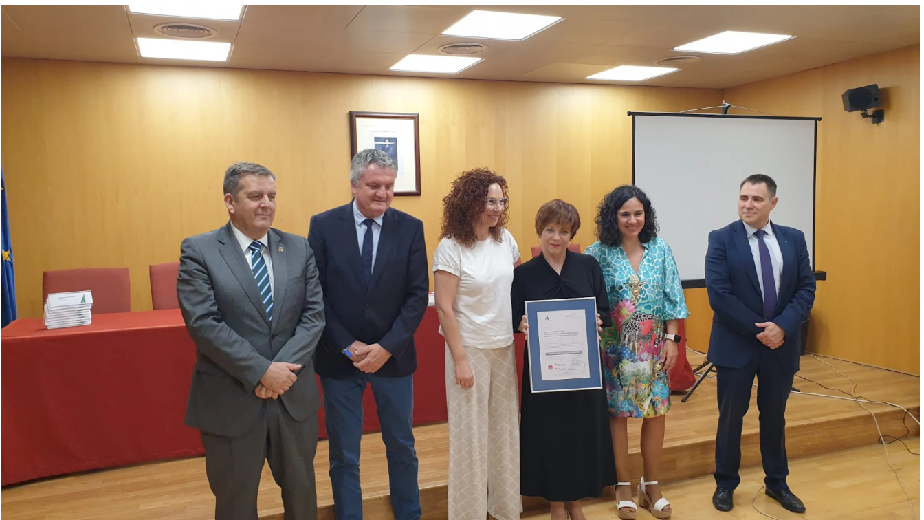
El Hospital de Poniente ha recibido una nueva certificación de calidad. LA VOZ

Recibe el distintivo de Nivel Avanzado de la ACSA