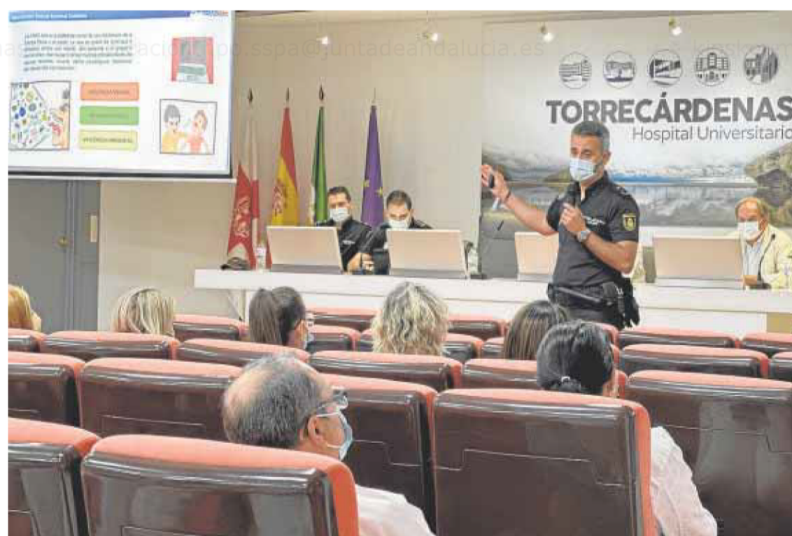
A las charlas impartidas por la Policía asistieron unos 200 profesionales sanitarios. IDEAL

Se calcula que a los actos asistieron unos 200 profesionales sanitarios, con los que a través de distintas dinámicas de grupo se lograron los objetivos propuestos, consolidando los lazos exis-