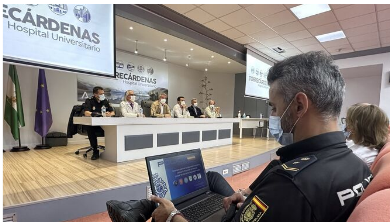
Una de las sesiones en el Hospital Universitario Torrecárdenas. / D.A. (Almería)