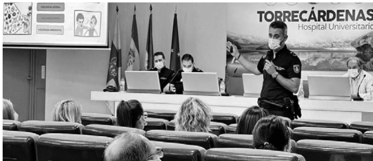
El interlocutor sanitario policial habla a los profesionales de Torrecárdenas sobre agresiones físicas.

Se calcula que a los actos asistieron unos 200 profesionales sanitarios, con los que a través de distintas di-