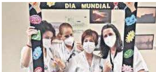
Profesionales del Poniente, con motivo de la campaña divulgativa.