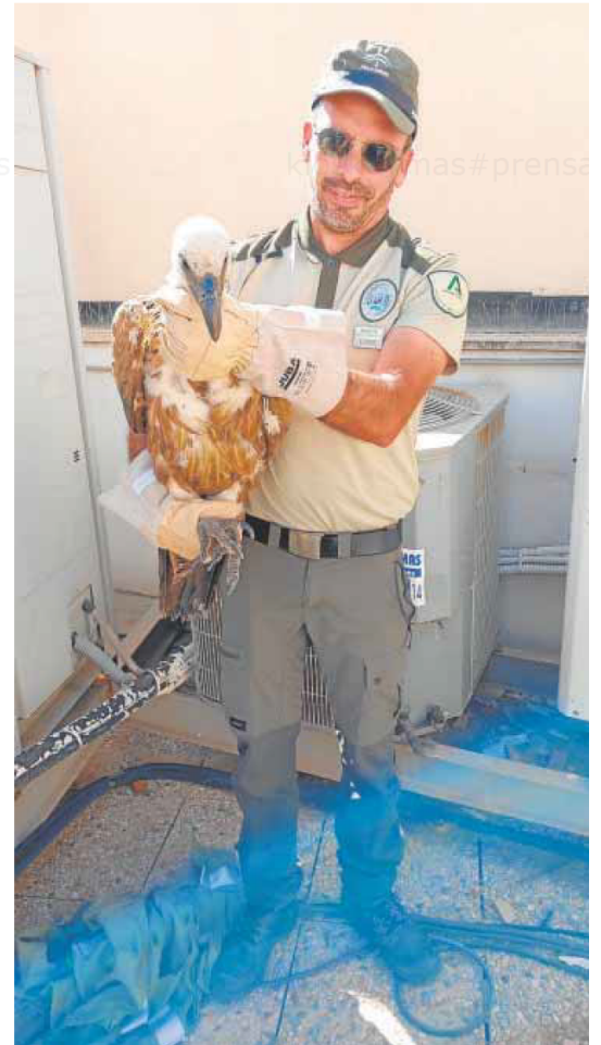
Un técnico de Medio Ambiente sostiene el ave rescatada.

En estos momentos los agentes de la Consejería de Sostenibilidad, Medio Ambiente y Economía Azul, han trasladado al ejemplar de buitre leonado al Centro de Recuperación de Especies Amenazadas (C.R.E.A) las Almohallas de Vélez-Blanco, donde permanecerá hasta recuperar