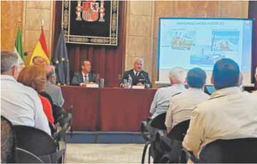
Presentación, ayer, en la Subdelegación de Almería.

del Cuartel General Marítimo de Alta Disponibilidad, fue el encargado de desgranar cómo serán las maniobras y sus principales hitos en este 2023. «Flotex-23 es el principal ejercicio avanzado de la Armada, es anual y concentra la mayor parte de las Fuerzas Armadas e incluso de otros países. También contribuye a los planes de la OTAN de disuasión y defensa del Mediterráneo Occidental», comentó.