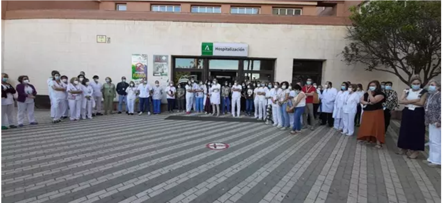
Protesta contra las agresiones a personal sanitario en El Ejido (Almería).

EL EJIDO (ALMERÍA), 3 May. (EUROPA PRESS) -