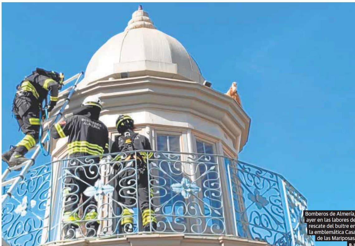
Bomberos de Almería, ayer en las labores de rescate del buitre en la emblemática Casa de las Mariposas. R. I.

na de junio cuando dos submarinos, 19 buques y 5.000 militares se despliegan en las playas de El Alquíán y Quitapellejos, en el marco del curso de las maniobras navales 23. Será el ejercicio más avanzado de la Armada en este año, diseñado para adiestrar, valorar y analizar la capacidad de la Fuerza Naval. P213