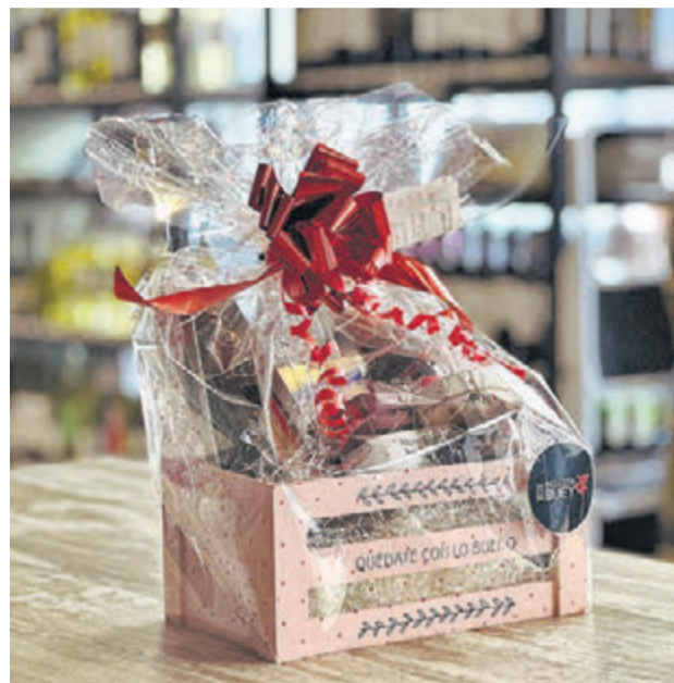
En calle Gregorio Marañón, 32. LA VOZ

También podrán encontrar la más amplia bodega