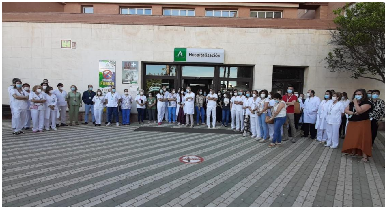
PROTESTA CONTRA LAS AGRESIONES A PERSONAL SANITARIO EN EL EJIDO.