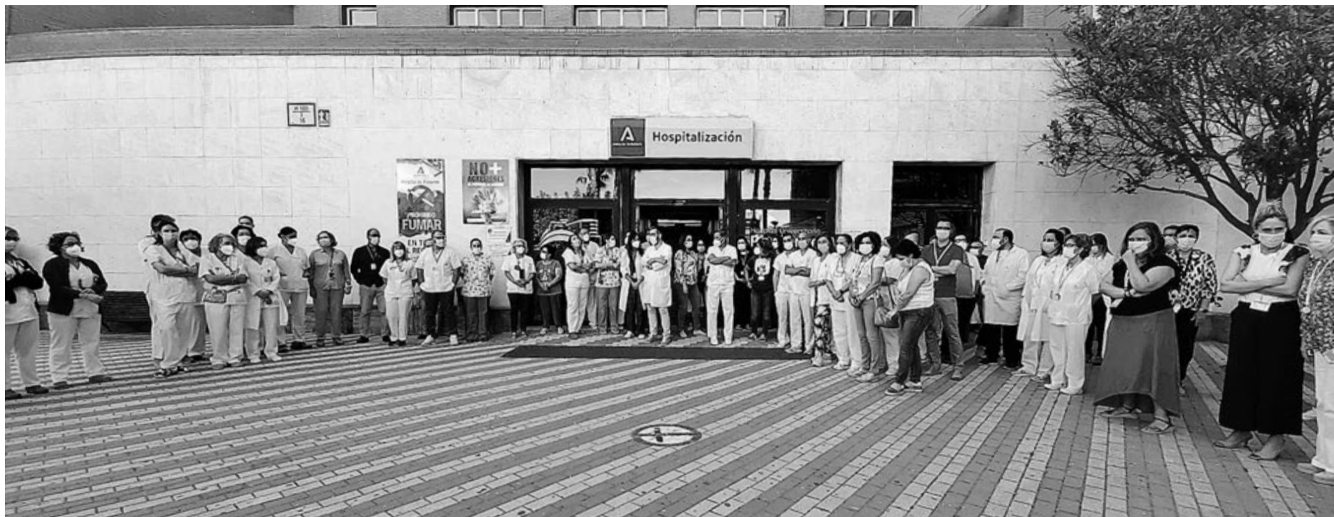
Concentración en el Hospital Universitario del Poniente en apoyo de la celadora.