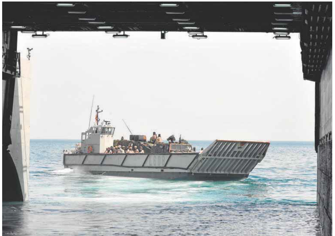
Una de las maniobras realizadas en el ejercicio Flotex en años anteriores.