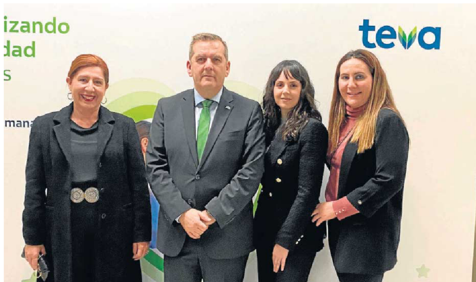
Los cuatro profesionales del Hospital Universitario Poniente que acudieron a la entrega del galardón en Madrid.

● Los premios 'Humanizando la Sanidad' de TEVA reconocen el proyecto 'Mis Recuerdos', y la iniciativa 'Siempre en Mí' ha sido seleccionada como finalista