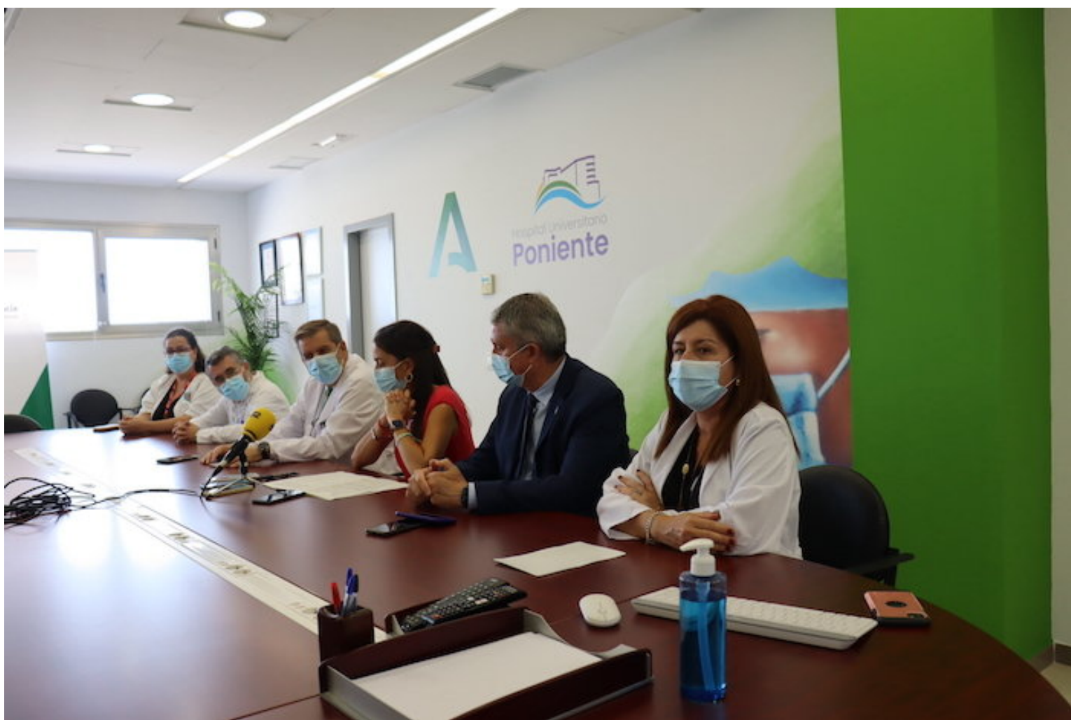
i Presentación Hospitales Humanos en el Poniente

Esta iniciativa, promovida por ROCHE, aúna planes de humanización en la atención sanitaria de diferentes centros españoles