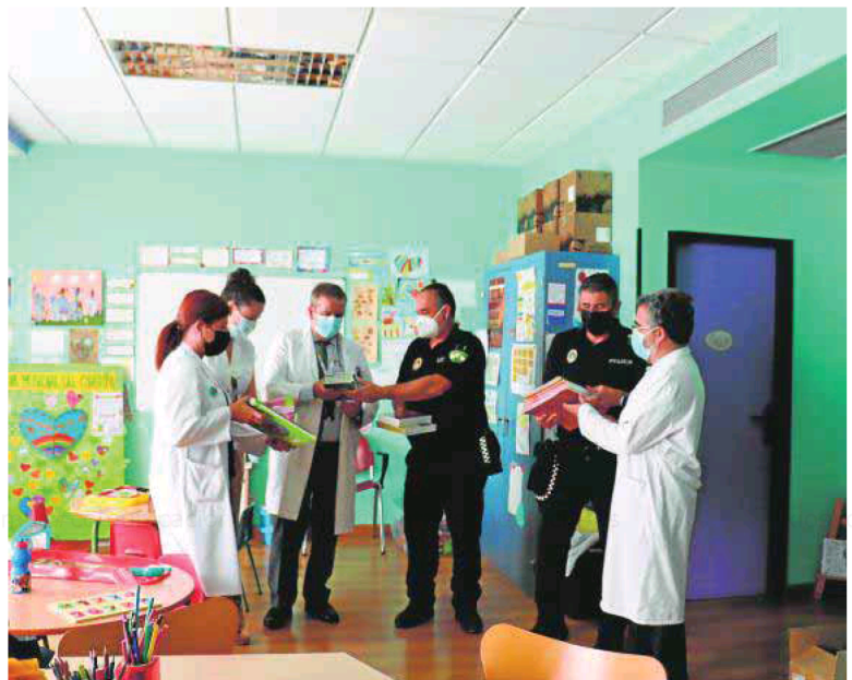
Los agentes de Policía Local de Adra visitaron el área de Pediatría del Hospital Universitario Poniente. r. i.