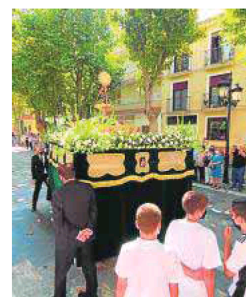
Virgen del Pilar, Berja. r. i.

desde la parroquia de la Anunciación y continuará por la calle Mártires de la Alpujarra, Placeta de las Monjas, calle El Greco, Chiclana, Picadero, Agua, Paseo de Cervantes, calle Carolinas, Cura Antonio Martín, Avenida Manuel Salmerón, calle Agua, Puente Lozas, Plaza de la Constitución, calle Salvador Dalí,