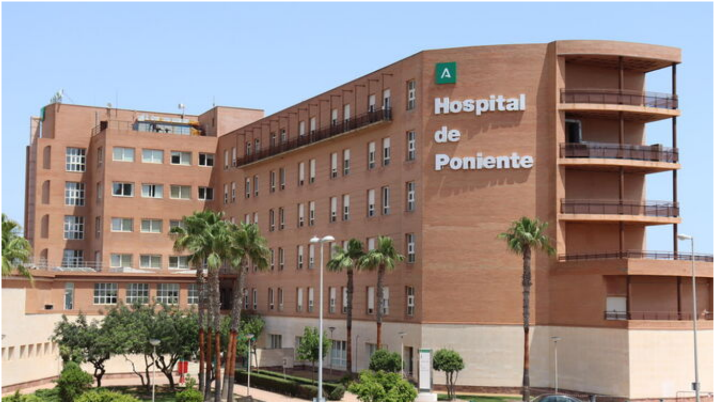
Vista exterior del Hospital Universitario Poniente (archivo).

Un apersona ha recibido el hígado y otra un riñón gracias a esta donación