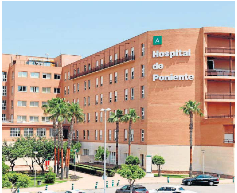
Vista exterior del Hospital Universitario Poniente (archivo).

La generosidad de estos donantes y de sus familias, que han dado el paso de autorizar la donación en momentos especialmente complicados, tras la pérdida de un ser querido, han permitido en total realizar dos trasplantes de hígado, cuatro de riñón, un trasplante bilateral de pulmón y 8 de córneas. A ello hay que sumar una veintena de unidades óseas, que se