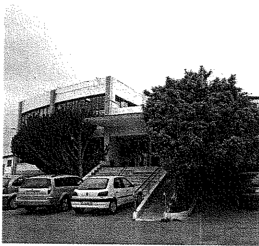
LAS INSTALACIONES del CUAM son garantía de calidad.

El CUAM es fruto de un convenio de colaboración firmado en 1993 entre la Concejalía de Agricultura ejidense y la UAL y en estos días ha conseguido la máxima acreditación posible en España para garantía de certificación de la calidad de alimentos, la otorgada por la ENAC, lograda por primera vez ya en 1998, siendo el primer laboratorio andaluz que consiguió tan prestigioso