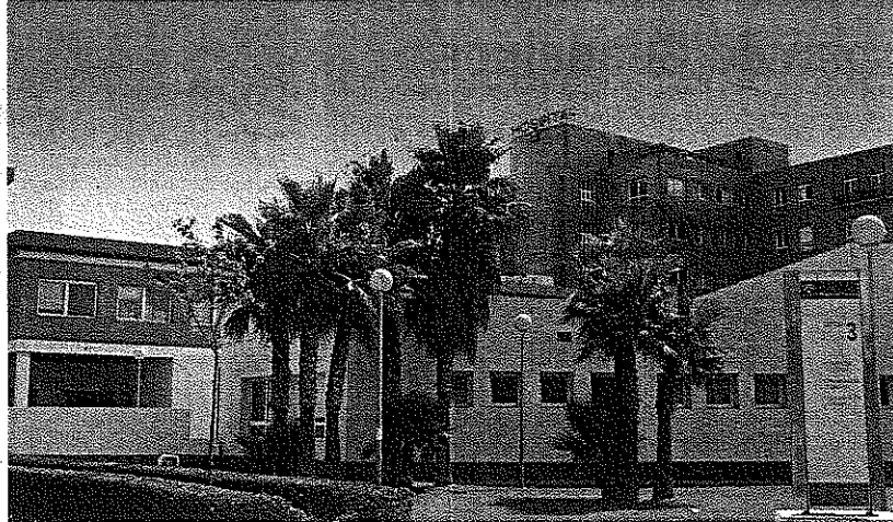
LAS MEDIDAS han sido impuestas por la gerencia de la empresa pública.

Los representantes sindicales de los tres centros que integran la Empresa Pública Hospital de Poniente (el Hospital de El Toyo, el Hospital de Guadix y el propio Hospital de Poniente) han informado de que los trabajadores comenzarán a movilizarse como medida de protesta tras notificarles la directora gerente que a partir de junio se aplicará un recorte salarial de un 5% en todos los conceptos de la nómina de los trabajadores como única medida de ahorro. "Los profesionales de la EPHP son personal laboral y están sujetos a un convenio colectivo particular, por lo que los recortes salariales que se aplicarán en la empresa son ilegales. No se puede imponer ni alterar la tabla retributiva de los trabajadores bajo el marco de un convenio colectivo", explicaron desde los distintos sindicatos. Los trabajadores han propuesto crear una comisión para proponer