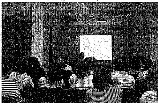
AFIAL durante su charla en el distrito de Poniente.