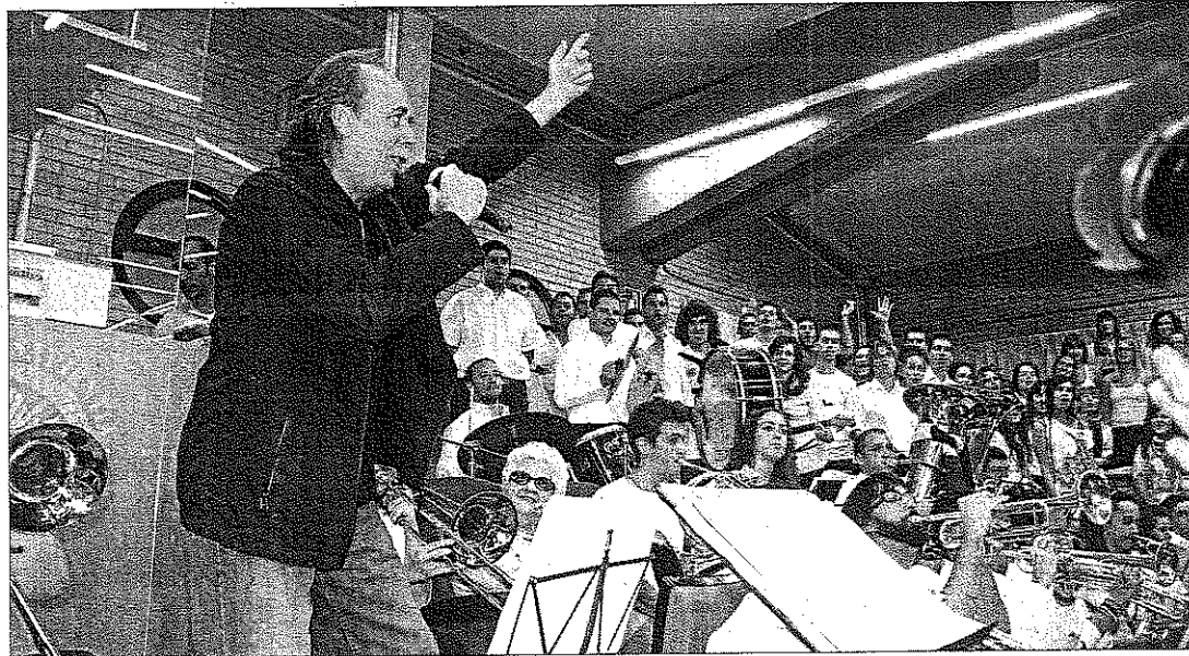
Joan Manuel Serrat se arrancó a interpretar 'Mediterráneo' y 'Cantares' con la banda de la Universidad.