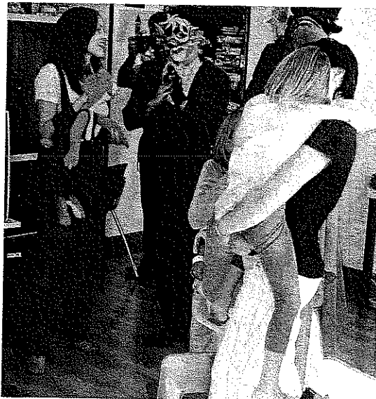
CANCIONES. Los personajes no pararon de cantar canciones. /E.C.