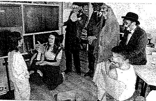
SORPRESA. La pequeña se sorprende al descubrirlos.

mido en una trepidante aventura, llena de buen humor y muchas sorpresas. Todo ello aderezado además con canciones en directo de las conocidas melodías que el grupo Mocedades interpretó para la serie de televisión, aunque acom-