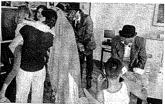
TÍMIDOS. Algunos no podían esconder su timidez.