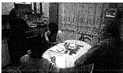
Familiares de los marineros, a la espera de noticias.

Crece la angustia de los familiares y el PP lamenta la falta de estrategia PÁGS. 24 Y 25