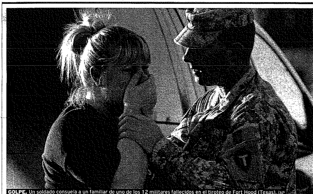
GOLPE. Un soldado consuela a un familiar de uno de los 12 militares fallecidos en el tiroteo de Fort Hood (Texas).

La principal propiedad a nombre de Isabel Carrasco es un ático de 171 metros