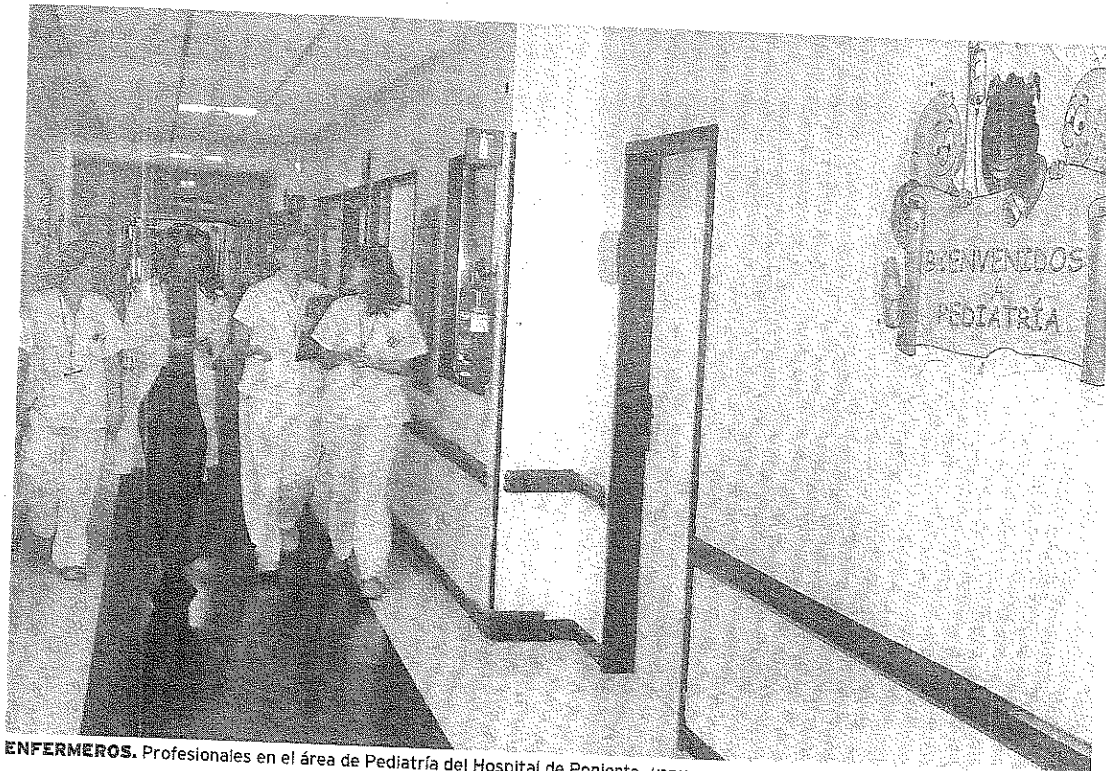
ENFERMEROS. Profesionales en el área de Pediatría del Hospital de Poniente.