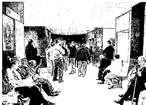
MENOS ESPERA. Gracias a ella la espera se reduce.

De otra parte, tanto el director de la Unidad de Digestivo del Hospital de Poniente, así como el especialista en Aparato Digestivo, coinciden en que el desarrollo de esta enfermedad está incrementando especialmente en la población caucásica, siendo mucho mayor el número de pacientes.