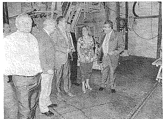
EMPRESA. Un momento de la visita a Plastimer.

La falta de liquidez para la adquisición de materias primas para la producción que ya tenía contratada la empresa, agravada por la situación económica y unida a un aumento de la inversión por la transformación de las líneas de producción, generó dificultades para el mantenimiento de la actividad y, por tanto, el empleo en el grupo empresarial, dificultades que han sido paliadas gracias a la ayuda otorgada por la Consejería de Empleo.