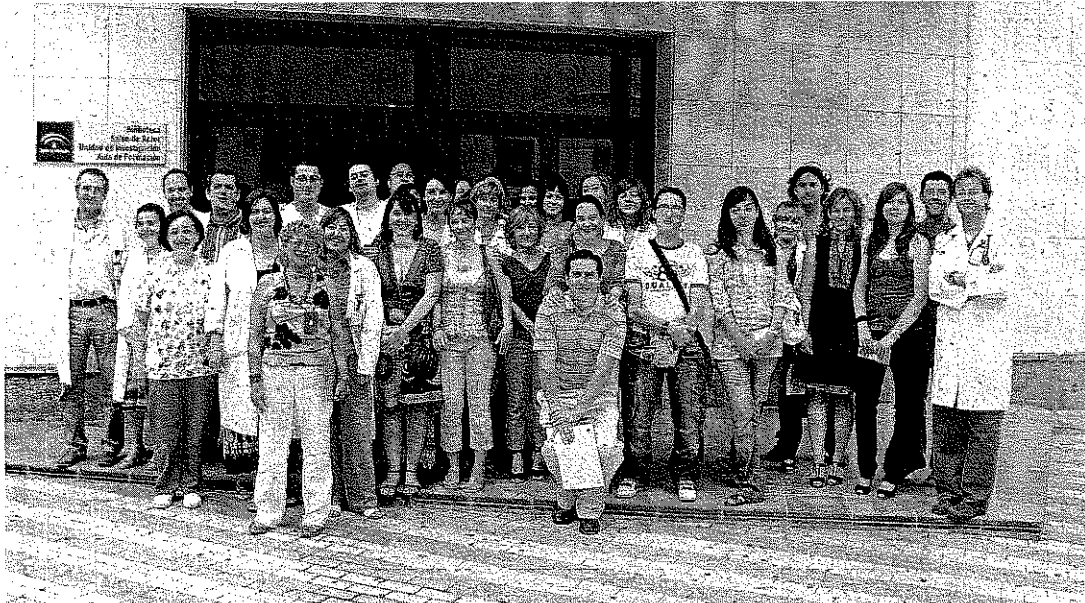
MÉDICOS. Los nuevos MIR que van a iniciar su formación en el Hospital de Poniente.