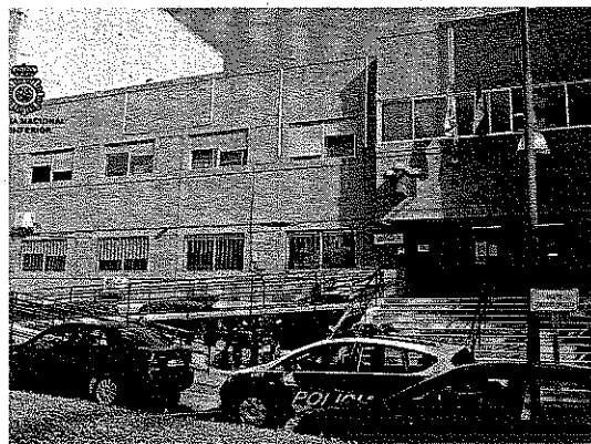
DEPENDENCIAS. Comisaría Local de El Ejido.

Los hechos ocurrieron en la madrugada del pasado día 12, cuando agentes de Seguridad Ciudadana acudieron a una llamada en la