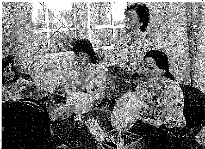
MANUALIDADES. Taller de marionetas del grupo de teatro La Trola, celebrado en el hospital.

- Lo haré por mi cuenta, pero quiero disfrutar del verano lo máximo posible. No me lo tomé muy en serio porque hay que disfrutar de la experiencia, quiero conocer gente y probaremos suerte de nuevo.