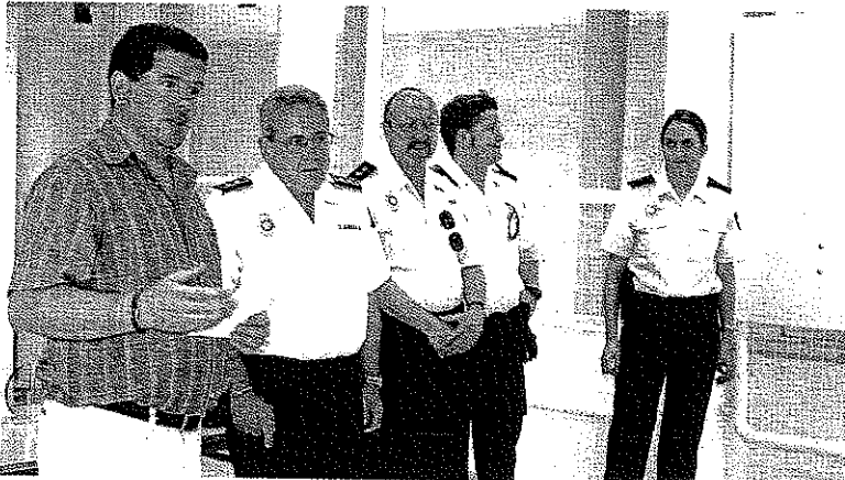
CLAUSURA DEL ACTO en el IES Murgi.