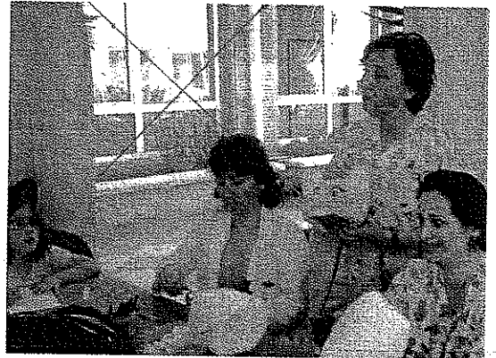
ESTAS ACTIVIDADES están principalmente dirigidas a los alumnos hospitalizados.

DIFERENTES NACIONALIDADES En las mesas informativas que también se han colocado en la entrada del Hospital han participado colectivos de Argentina, Guinea Bissau y Marruecos.