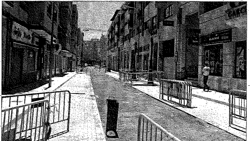
Las mejoras que se están realizando en las calles del centro con el fondo anticrisis, embellecerán más este proyecto.

Con el estudio de viabilidad, que estará listo en septiembre, se pretenden conocer las necesidades de la zona y comercios que integrarán un proyecto que verá la luz después de una década de retraso y del que se beneficiarán en principio, 70 comercios ejidenses.