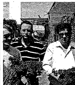
Reparto de clavetes.