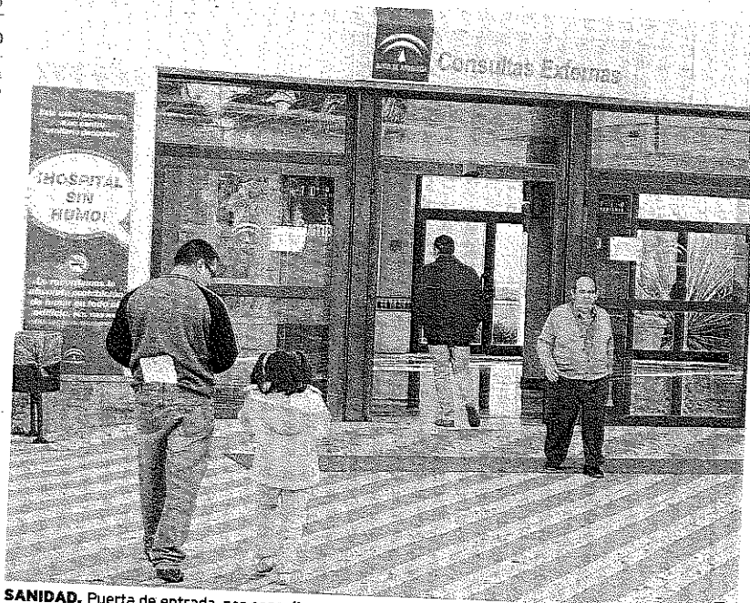
SANIDAD. Puerta de entrada, por consultas externas, al Hospital de Poniente.

En cualquier caso, para Linares, la principal virtud de este nuevo convenio colectivo es que va a permitir tener una plantilla más estable -término del cual se han quejado en varias ocasiones desde los sindicatos del ámbito