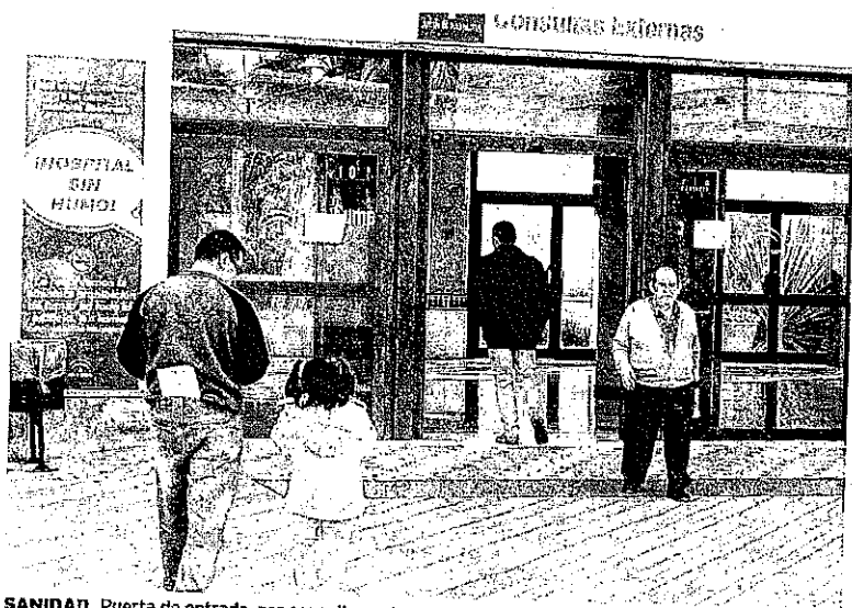
SANIDAD. Puerta de entrada, por consultas externas, al Hospital de Poniente.