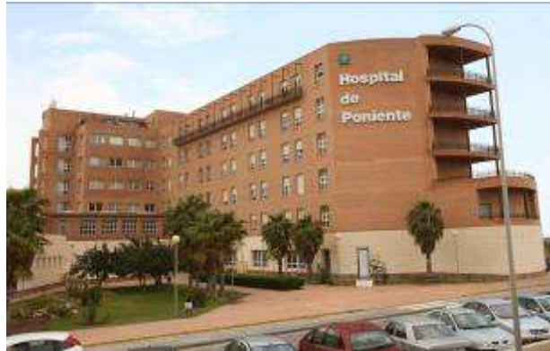
Hospital de Poniente, El Ejido, Almería