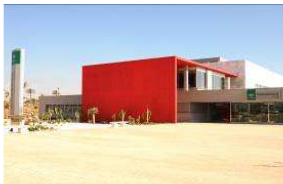
Hospital de Alta Resolución El Toyo, Almería