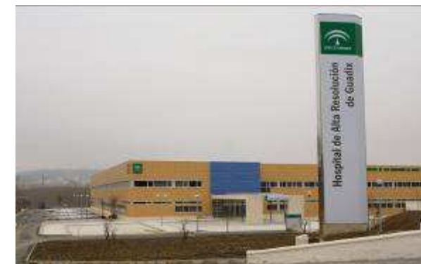
Hospital de Alta Resolución de Guadix