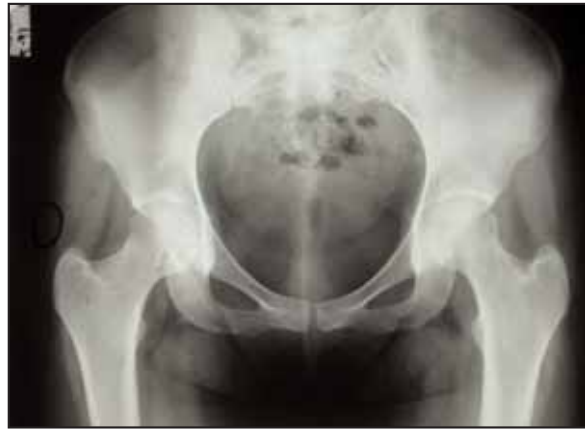
Figura 3. Rx simple al final del proceso. La paciente está asintomática.

Trascurridos los 3 meses de la descarga, la clínica remite de manera importante siendo definitiva a los 4. Se le realiza un nuevo estudio con Rx simple (Figura 3) y RMN (Figura 4), en el que se aprecia la resolución radiológica del cuadro.