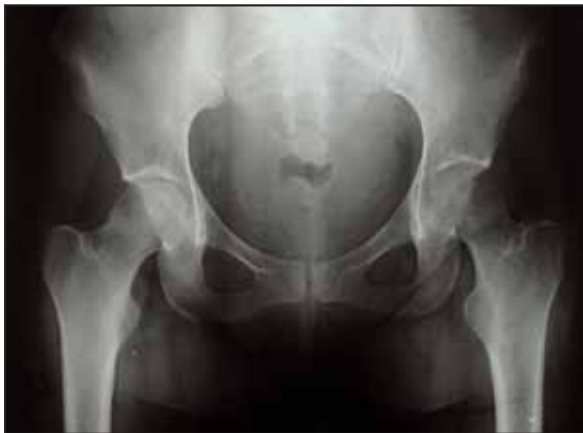
Figura 1. Rx simple de pelvis. Osteopenia franca en la cabeza y cuello femoral izquierdos.

Finalizada la gestación se realiza radiografía simple de pelvis donde se ve una osteopenia franca de la cabeza y cuello femoral izquierdo (Figura 1).