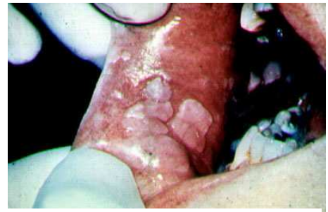
Human Papillomavirus (HPV) Buccal Mucosa

El número de parejas sexuales vaginales (>25) o parejas sexuales orales (>5) a lo largo de la vida se asoció con cáncer orofaríngeo. Esta asociación aumenta a medida que se incrementa el número de contactos sexuales. El cáncer orofaríngeo se asoció significativamente con la infección por el HPV-16 (Odds ratio (OR)=14,6 Intervalo de confianza (IC) 95% 6,3-36,6, la infección oral de cualquiera de los 37 tipos del HPV y la seropositividad para la proteína L1 del HPV-16 (OR=32,2 IC 95% 14,6-71,3). Esta proteína L1 se encontró que estaba fuertemente asociada con el cáncer orofaríngeo tanto entre sujetos con abuso de alcohol y tabaco (OR= 19,4 IC 95% 3,3-113,9) como en aquellos que no fuman o consumen alcohol (OR= 33,6 IC 95% 13,3-84,8)